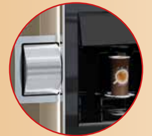
Optional erhältlich mit vollautomatischem Trinkdeckelspender