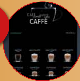
Brillante und solide verarbeitete Full-HD Touchscreen-Formate in 15,6" und 34"