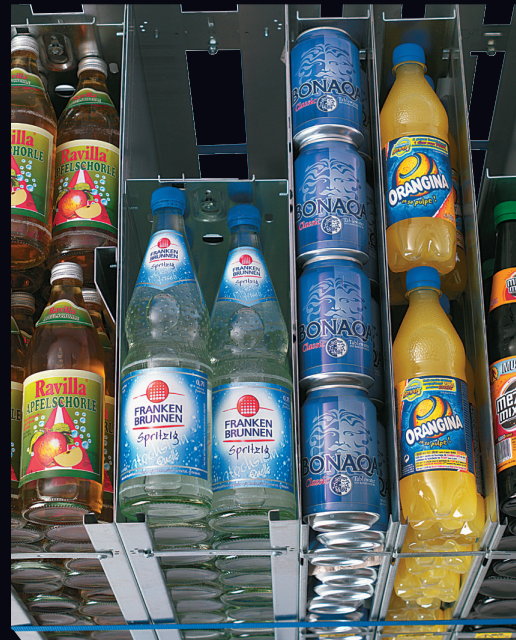
Optimale Kühlraumausnutzung und Anpassung an das Produktangebot durch variablen Einsatz von Normal- und Schmalschächten.