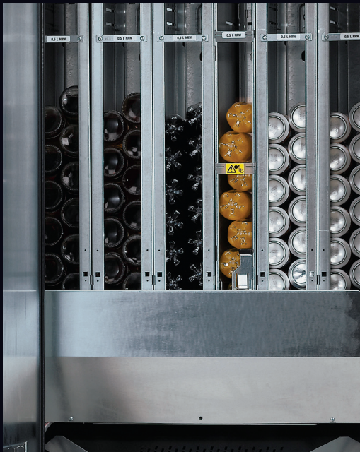
Elektronisch geregelte Hochleistungs-Einschubkühlung mit optimiertem Kreislauf